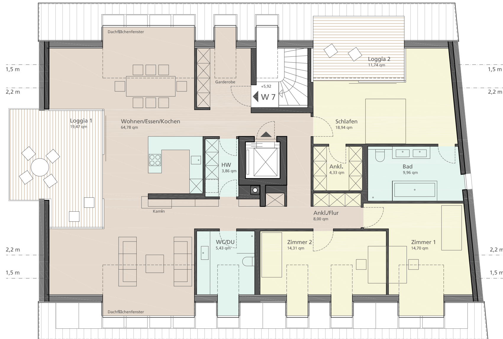
WOHNUNG 7 159,97 qm